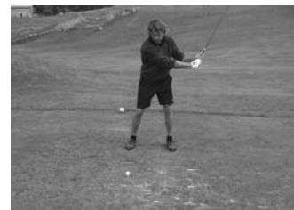
Classement complet et photos sur notre site www.aveps.ch