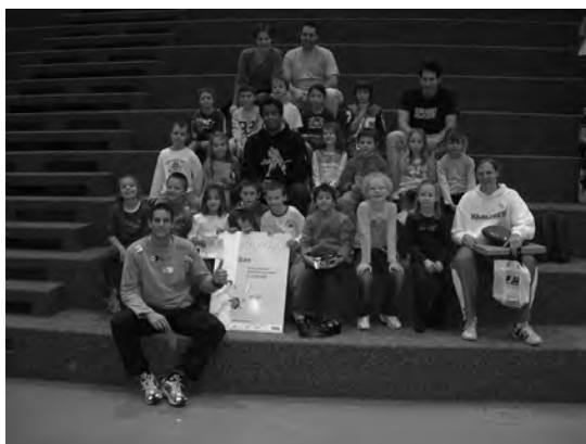
La classe vaudoise avec ses maîtres et quelques stars

À l'avenir l'école bougera toujours, puisqu'en mai une telle journée sera reconduite pour récompenser les classes inscrites entre août 2006 et juin 2007. En parallèle le SEPS tirera au sort une classe vaudoise pour la féliciter de ses efforts. Plus de temps à perdre, faites un tour sur le site http://www.ecolebouge.ch/ et encouragez des classes à s'y inscrire !