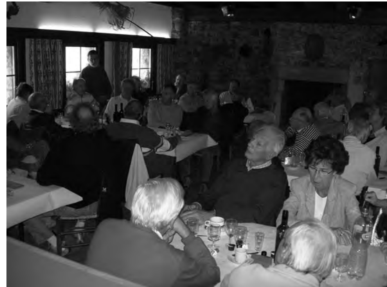
Dîner au Mont d'Orzeires lors de la journée des retraités