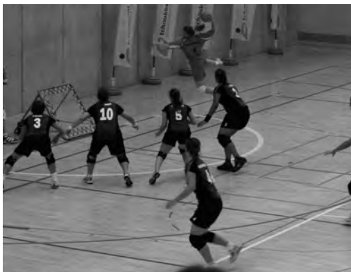
Photo 3: Les 2 premières lignes de défense lors d'un match sur grand terrain